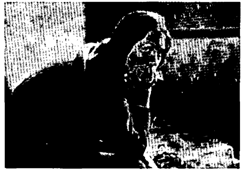
Procès de Jeanne d'Arc

La Nouvelle Vague des années 60 filma (typa) interminablement des individus que le hasard, leur orgueil ou la méchanceté ambiante avaient mis en marge de la « société », du « monde ». Bresson, depuis Pickpocket , fournit le modèle idéologique et formel à la mise en scène de cette marge. Idéologique, en choisissant pour héros de ses films les moins récupérables (sinon par Dieu, qui voit tout) : un pickpocket ou une sainte. Formel, en filmant des regards que rien au monde ou dans le hors-champ (c'est la même chose) ne pouvait combler, suturer. Bresson invente le dispositif qui permet de fétichiser le face à face entre l'acteur-objet comme révolté et le sujet-auteur comme bénéficiaire de la révolte. Jouir de ce que l'autre laisse échapper. « Modèle. Tu lui dictes des gestes et des paroles. Il te donne en retour (ta caméra enregistre) une substance. » (Notes sur le cinématographe.)